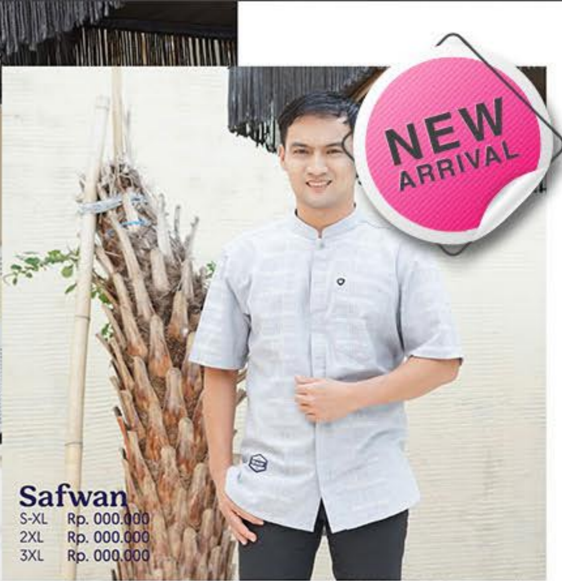
Safwan S-XL Rp. 000.000 2XL Rp. 000.000 3XL Rp. 000.000