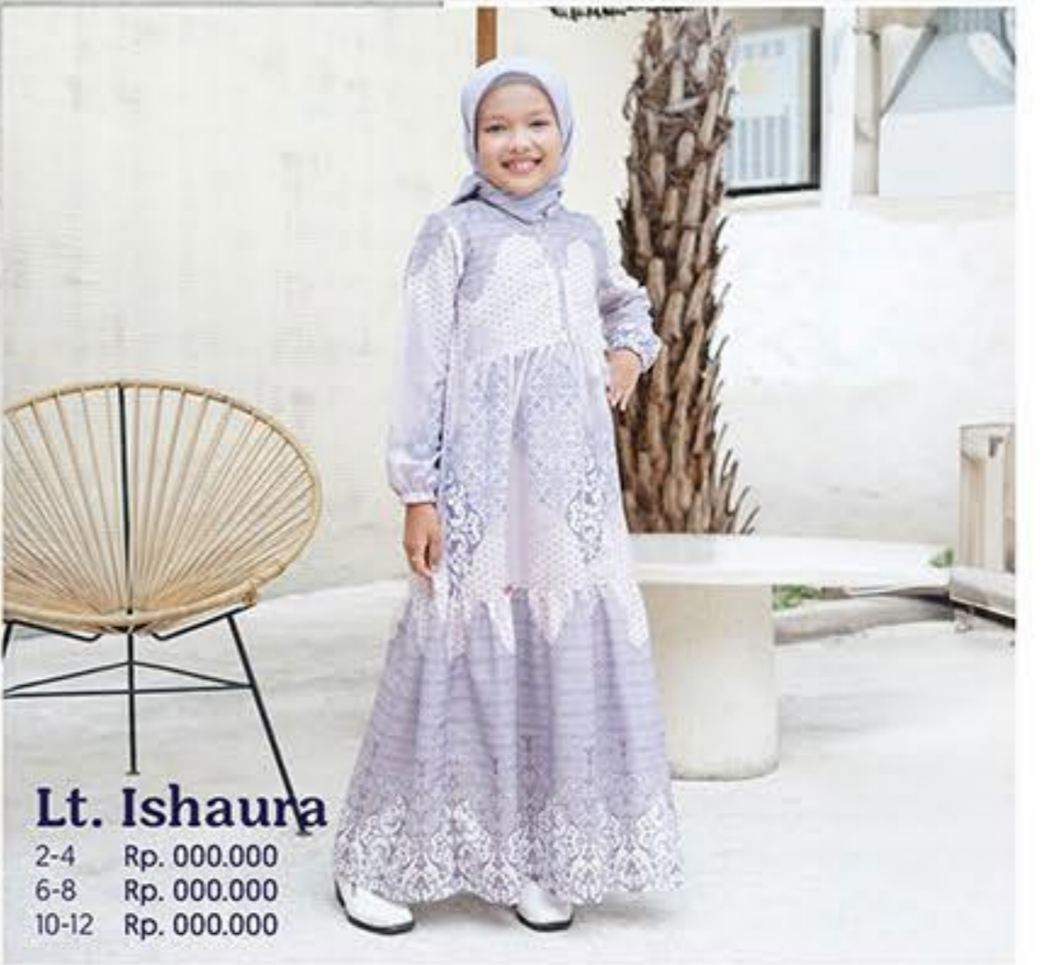
Lt. Ishaura 2-4 Rp. 000.000 6-8 Rp. 000.000 10-12 Rp. 000.000

Material : Ishaura Cotton Print Safwan Double Beam