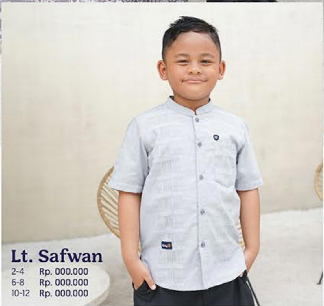
Lt. Safwan 2-4 Rp. 000.000 6-8 Rp. 000.000 10-12 Rp. 000.000