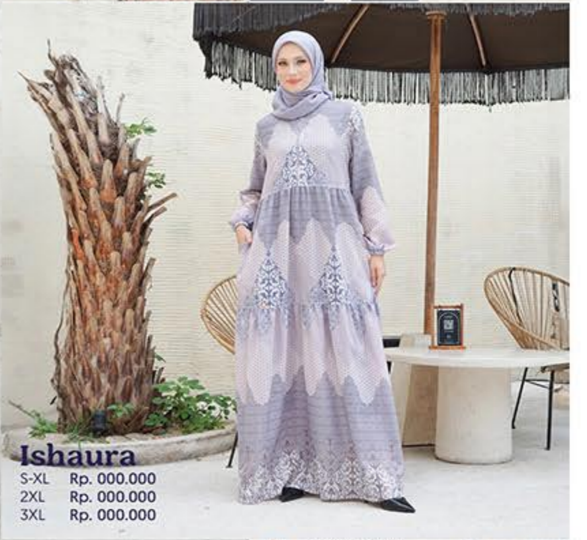
Ishaura S-XL Rp. 000.000 2XL Rp. 000.000 3XL Rp. 000.000